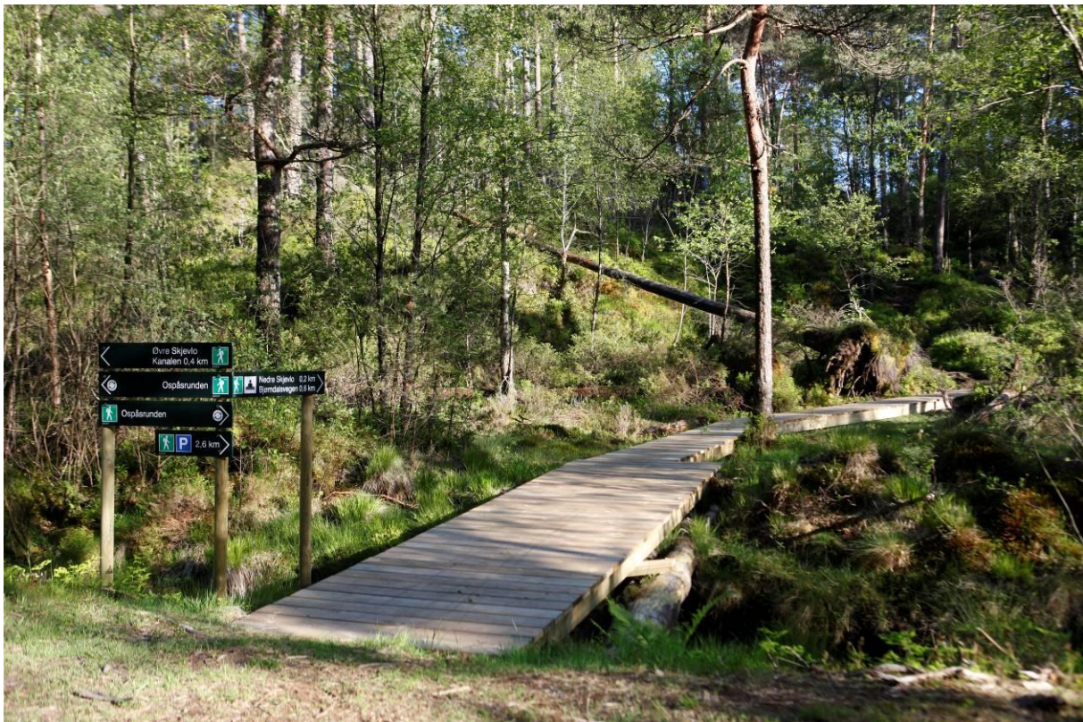
Frå Skintveitmarka.

Gjennomføring av tiltaka krev midlar. Det er her ikkje mogleg å setje faste kostnadskalkylar på slike parkeringsplassar, både grunna ulike nivå på standard frå prosjekt til prosjekt og kva for grunnforhold som gjeld på dei einskilde plassar. Planen legg opp til at gjennomføringa kan gjerast både av kommunen og private. Kostnadar ved ekstra parkeringsplassar ved kommunale anlegg må inn i økonomiplan investering. Er utbyggjar grunneigar eller frivillige/ideelle aktørar vil eit kommunalt bidrag måtte vere aktuelt i form av tilskot, noko som må inn i økonomiplan drift. Planen legg ikkje opp til at kommunen må eigna til seg grunn, men heller inngå langsiktige avtaler med grunneigar.