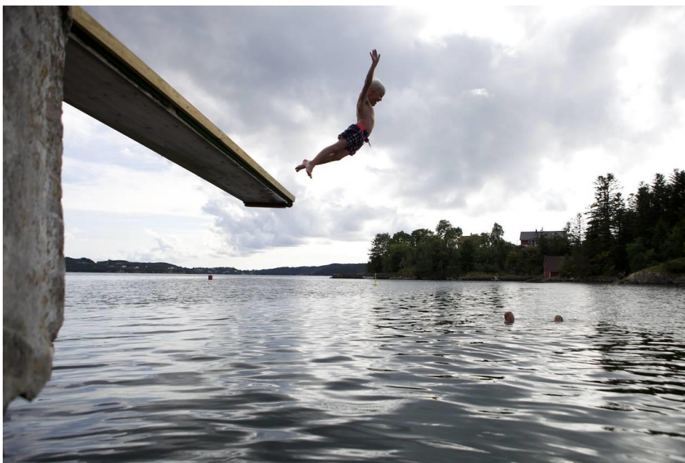
Fløksand friområde.

Prioritering: 1 – høva for reell utbetring avhenger av vegplanarbeidet.