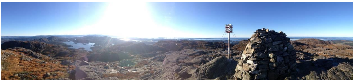
Veten på Eldsfjellet.

Prioritet: 1 – turstien mot Eldsfjellet har høg bruk og potensiale som regionalt turmål. Det er ofte trafikkfarlege tilhøve på store utfartsdagar.