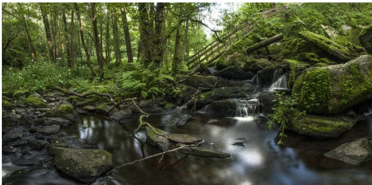
Nedanfor Fossen i Mjåtveitelva.