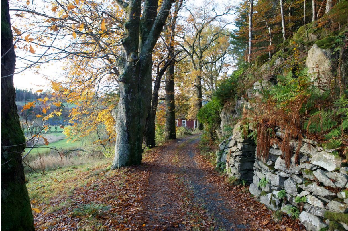
Meland Golf, Leirvik gard.

Parkeringa ved golfbanen vert òg nytta av turgåarar i golf- og naturparken, samt områda rundt Eikelandsvatnet. Det er utviklingsplanar ved golfbanen, som vil kunne medføre større parkeringskapasitet.