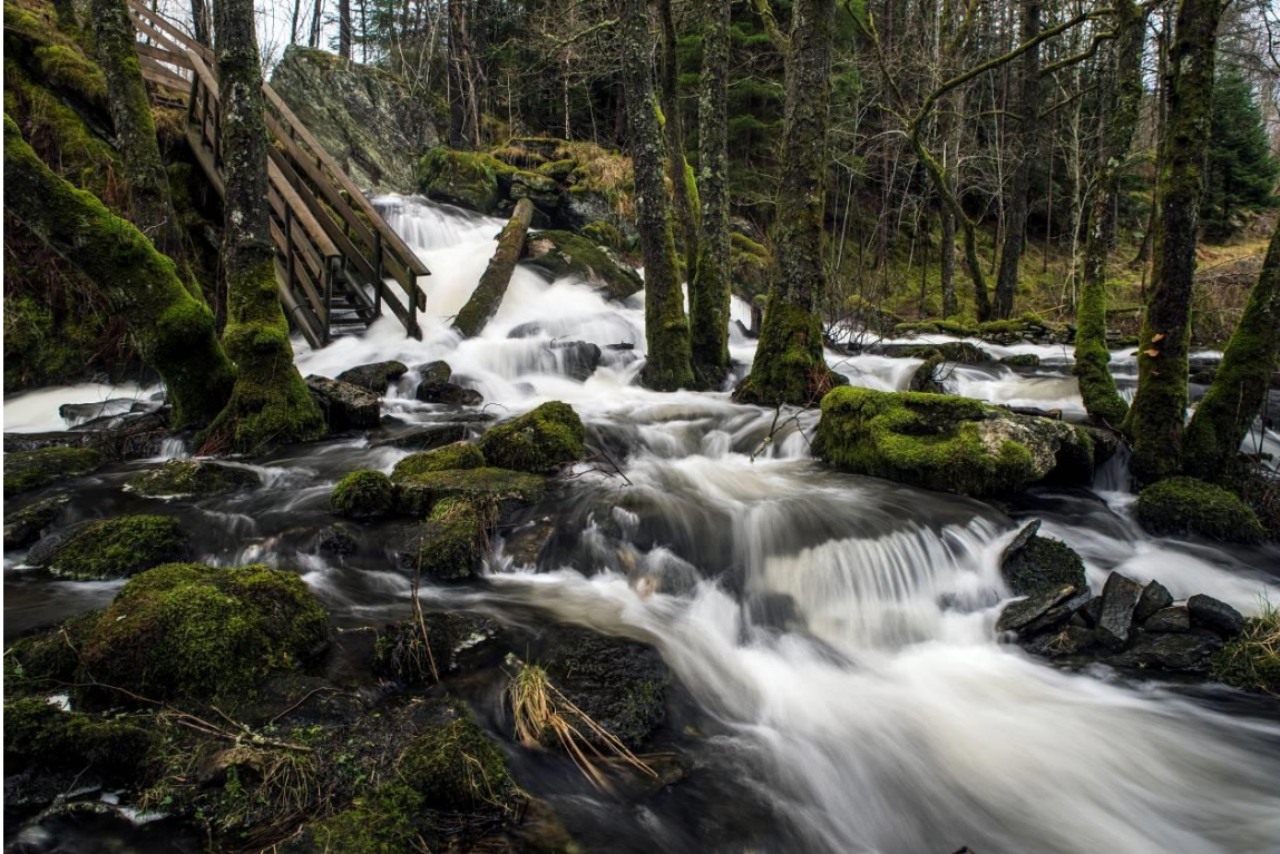
Fossen i Mjåtveitelva.