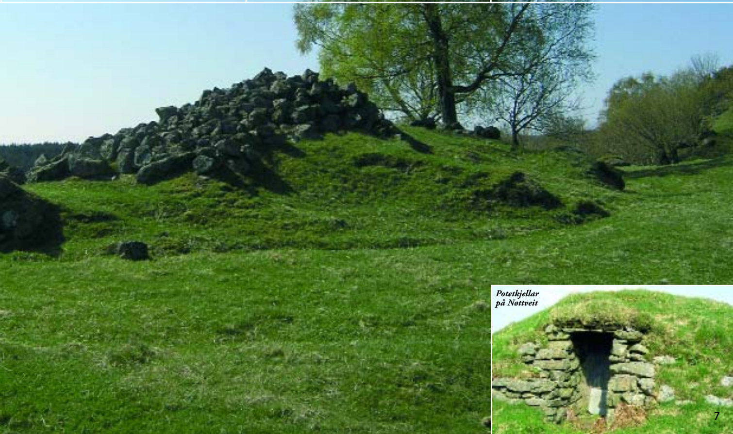
Potetkjellar på Nottveit