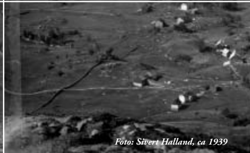
MANGER, SITT FRÅ NØTVEITVETEN.