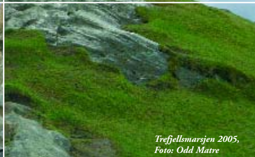
Treffellsmarsjen 2005

samanhengande og storslått kulturlandskap. Dette landskapet er også godt synleg frå Hurtigruta og andre båtar som går forbi Radøy. Manger Idrettslag arrangerer elles kvart år den populære Treffellsmarsjen over tusenårsstaden. Ein kan difor seia at mange kan sjå og oppleva tusenårsstaden til Radøy kommune på ulikt vis gjennom året.