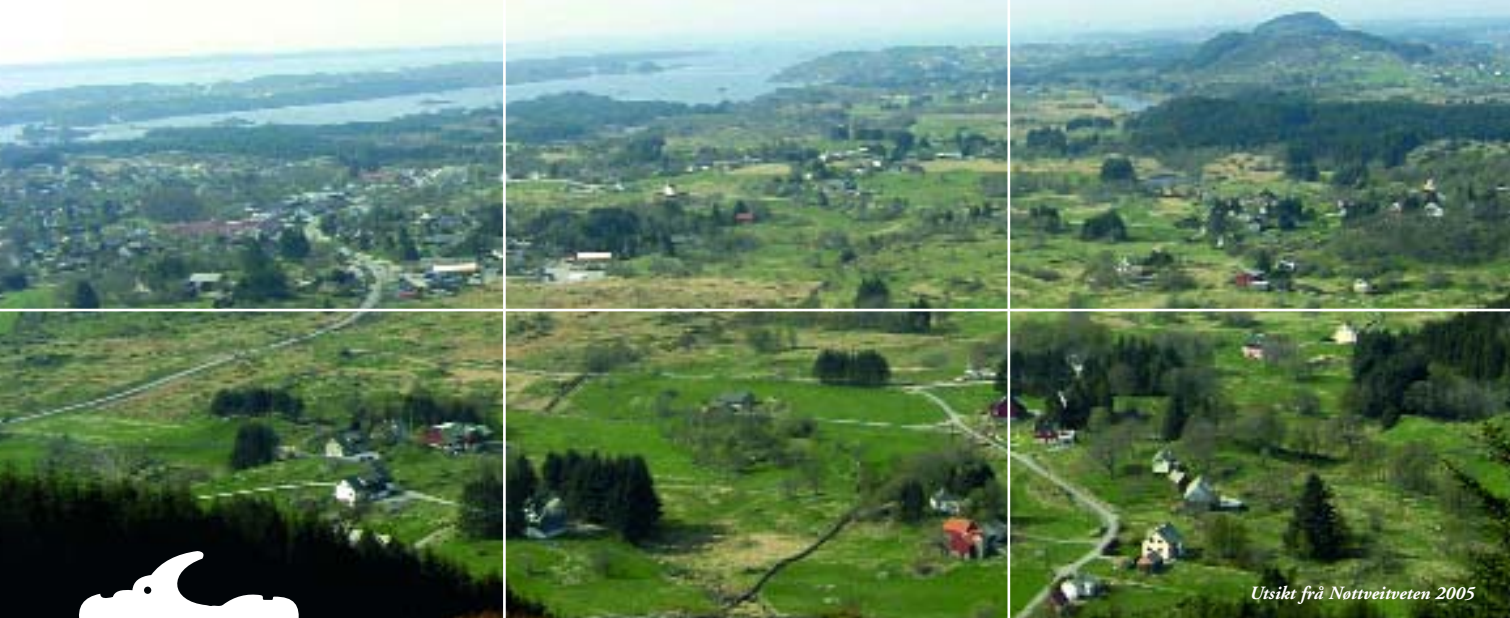
Utsikt fra Nøttveitveten 2005