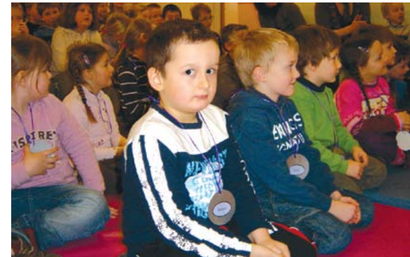
Medaljene er på plass hjå nokon, medan andre ventar spent på at navnet skal bli ropt opp.

Så kjem vitjinga på skulen og helsing på dei som skal bli fadrane deira når dei begynner. Fredag 14. mars hadde 1.-4. klasse kulturtime. Då var alle dei nye førsteklassingane innbedne til skulen. Dei fekk høyra kor flinke dei som går på skulen er blitt til å lesa og syngja og fortelja. Dei blei ønskt skikkeleg velkomne med opprop og skulemedalje. Etter kulturtimen kom 5. klassingane og tok dei med seg til nysteikte lappar, saft, eventyr, song og kos.