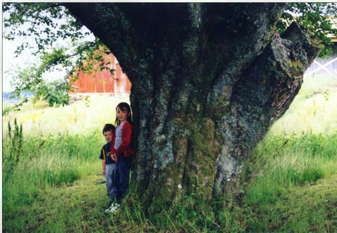
Me undrar oss på ... ?

har 9 medlemmer: 3 frå kommunestyret, 3 frå administrasjonen og 3 frå dei funksjonshemma sine organisasjonar.