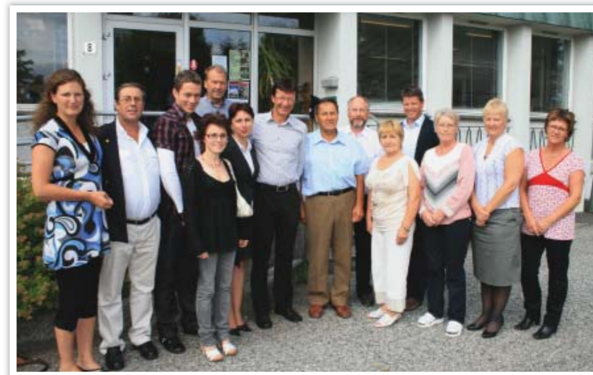
Radøy formannskap og gjestane frå Moldova.

Siste kvelden var det ei avskilssamkome på Hella skulestove. Gjestane takka Radøy for framifrå vertskap, og dei gav ros for den inkluderande måten det norske samfunnet har for unge, eldre og menneske med ulike funksjonshemmingar. I høve til Moldova framstår inkludering og ivaretaking av menneske med nedsett funksjonsevne som det som hadde gjort sterkt inntrykk. I tillegg var dei misunneleg på kor godt eldre menneske har det i Noreg. Dei gav oss også ein ståande invitasjon til å besøkje Crihana Veche kommune. For oss som møtte representantane frå Moldova, var besøket også lærerikt, og det sette nokre av våre eigne kvardagsutfordringar i eit nytt perspektiv. Radøy kommune nytta høvet til å avslutta dette referatet med å takka fadrar og alle andre bidragsytarar til Crihana Veche-aksjonen for innsatsen for å hjelpa andre!