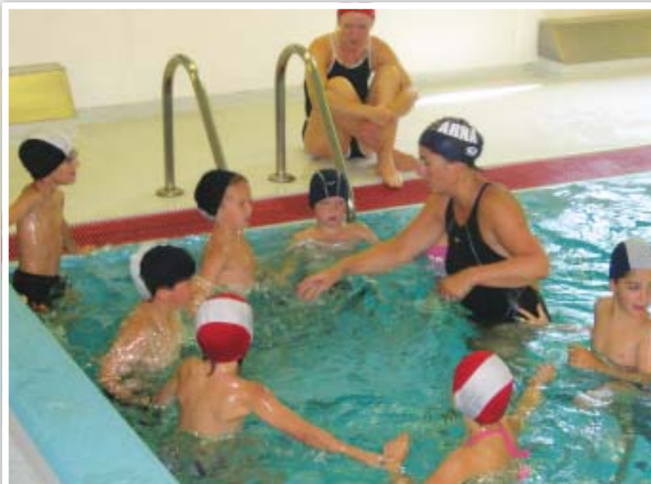
Vi er fullt konsentrert

Så no er det viktig at dei som kom godt i gang, får mor eller far med seg og går ofte isømhallen når dei er så godt i siget. Lukke till!