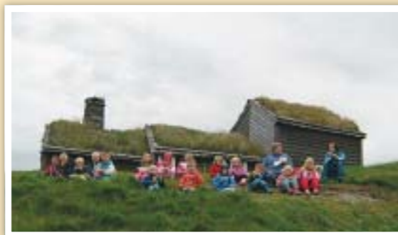
Litt mat etter omvisninga smaker godt.

Og som eit barn sa: "Bra at me kan gå på butikken å kjøpa. Da e so enkelt da"