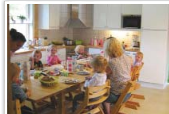
Slik ser det ut på Bjørnehiet etter oppussinga

Neste prosjekt vert no å få ordna ute på leikeområdet til borna. Vi har planane klare og vi vonar pengane strekk til, slik at vi får byrja på uteprosjektet før vi kjem alt for langt ut på hausten.